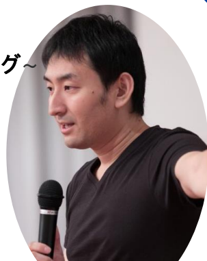
番匠塾 塾長 福島教育企画 代表

「 無料ウェブセミナー 」を9/4日(水)13:00-14:00で開催致します！是非、ご参加ください