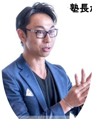
社団法人JAPANセルフマネジメント協会理事 株式会社FreeWillトータルエデュケーション代表取締役