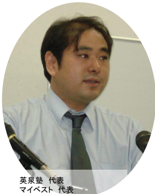
英泉塾 代表 マイベスト 代表